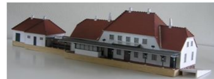
Perronsiden af hoved- og sidebygning i størrelsen 1:100.