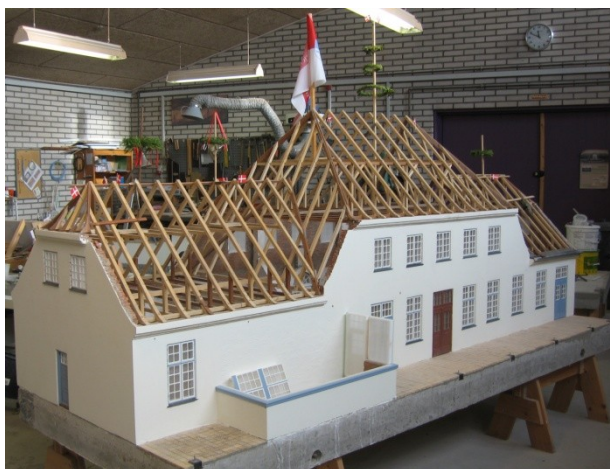
Vejen Station i størrelsen 1:10. Den kommunale vimpel er en hilsen fra Vejens borgmester, som var gæst i Minibyen ved rejsegildet den 10. november.