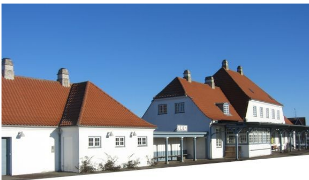
Vejen Station 2011 - i størrelsen 1:1

Wencks stationsbygning i Vejen har skiftet udseende et par gange. Her som den så ud i 2004. Bygningen er nu fredet.