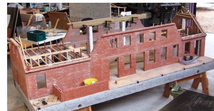
10. marts: Fundament til stationens hovedbygning i størrelsen 1:10 bliver støbt. 10. august: Færdigbyggede mure er rejst. Arbejdet med spær i gang. Se billedet! 10. november: Rejsegilde på Vejen Stations hovedbygning.