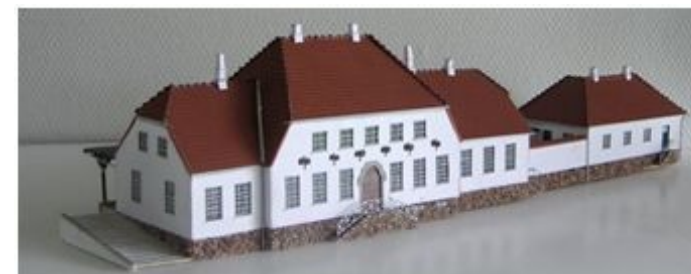
Vejen Station på terrænbordet i størrelsen 1:100. Hoved- og sidebygning på Banegårdspladsen.