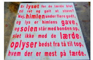
Er lyset for de lærde blot til ret og galt at stave? Nej, himlen under flere godt, og lys er himlens gave, og solen står med bonden op, slet ikke med de lærde. Oplyser bedst fra tå til top, hvem der er mest på færde.