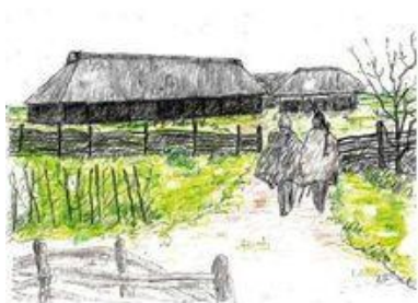
50 f. Kr. - 170 e. Kr.