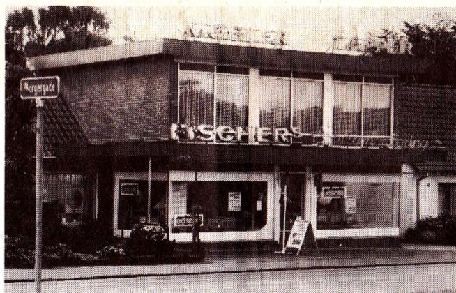
Der holdes nu ophørsudsalg i Fischers Boligmontering A/S.