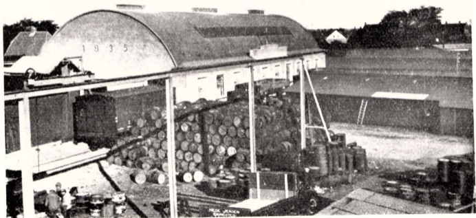
Phønix A:S, Vejen, 1936