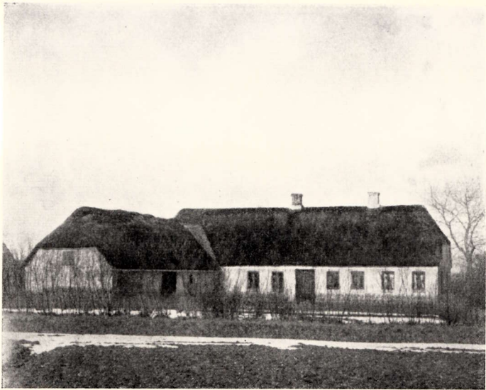
Gaarden Mølvang, Gjesten Sogn