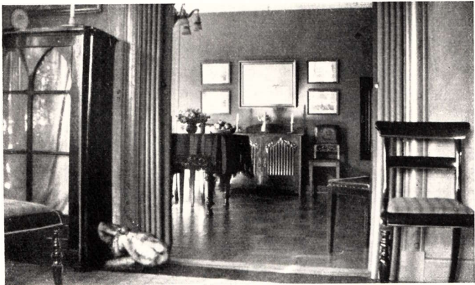
Interiør i Ejendommen Skovvejen Nr. 14