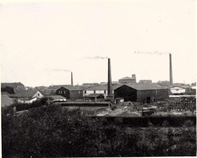
Tagpapfabriken Phønix A:S, Vejen 1919