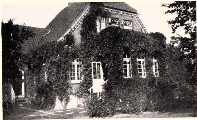
Ejendommen Skovvejen Nr. 14, Vejen