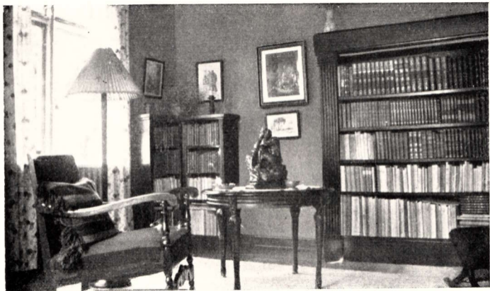
Interiør i Ejendommen Skovvejen Nr. 14