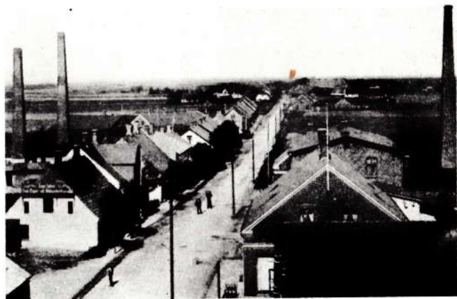
Byen set mod nord ca. 1900.

Jeg var nu lidt af et skrøvl i min barndom, hvilket i forbindelse med børnesygdommene: mæslinger, kig-