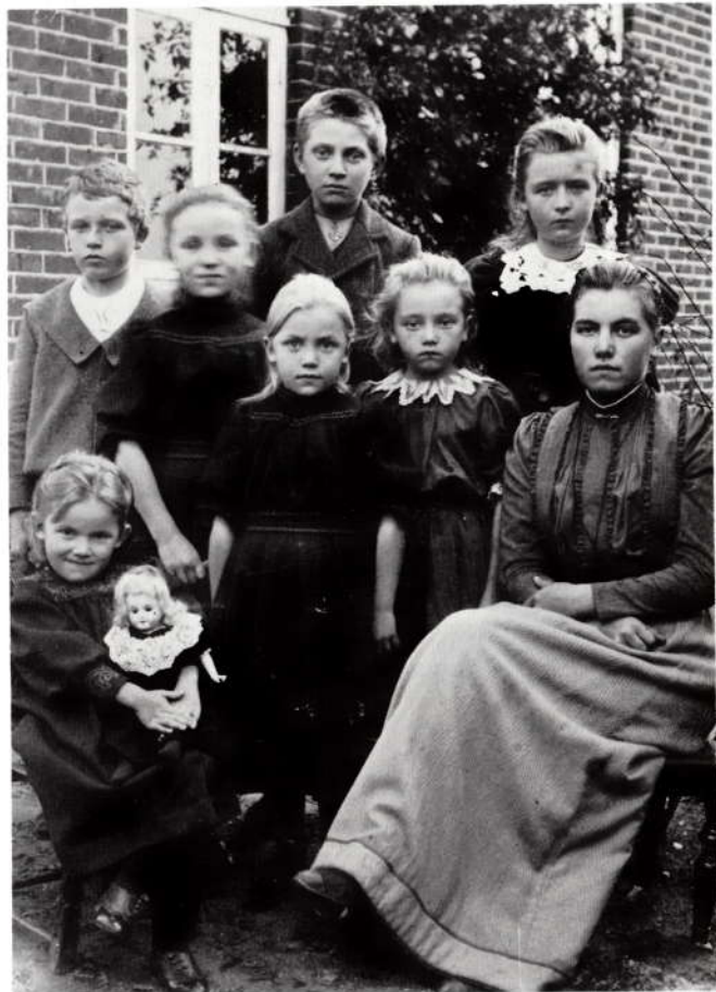
Friskolen i Refsing.