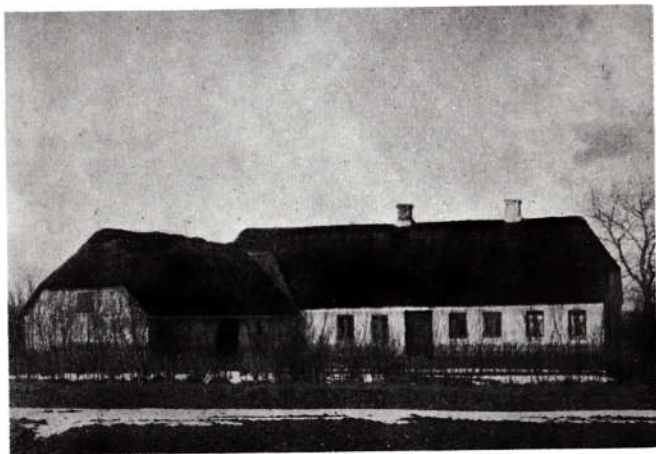
Barndomshjemmet hos os.

Min mor var »kraften« i hjemmet, den gode administrator, der opdrog sine børn i gudsfrygt og nøjsomhed. Streng kan man ikke sige, hun var. Hun har aldrig slået sine børn, men talte manende til dem. Det er mærkeligt nok! Det er små ting, man husker. En ting