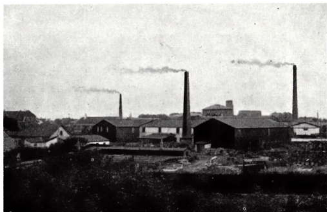
Tidlig foto af Tagpapfabrikken Phønix.