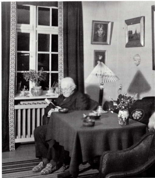
Hansen Jacobsen i sin stue i æresboligen.