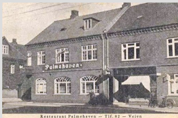
Restaurant Palmehaven — Tlf. 82 — Vejen

Så fulgte en stor bygning, hvor der solgtes herretøj (9). Det var en ekviperingshandler og en skrædder, der var gået sammen under navnet Jensen & Petersen .