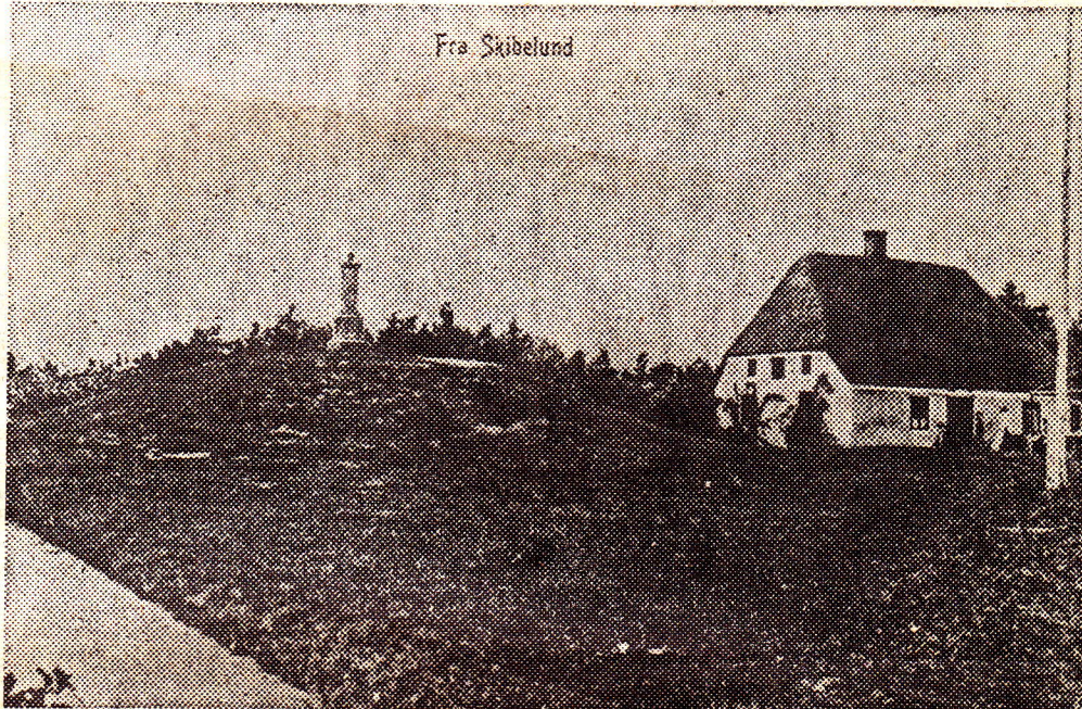
Huset, som det stod, da den første mindesten var rejst.