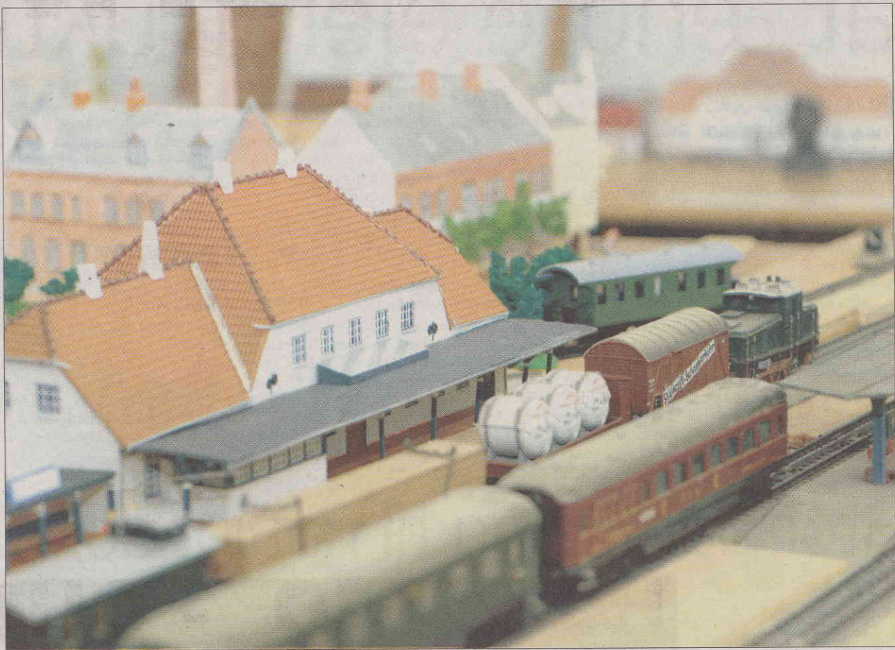
Vejen Banegård med Hansens Hotel i baggrunden. Hele området med jernbanen hører til én af de opgaver, der skal bygges af de frivillige.

Siden starten på foreningen er der opbygget en fast styrke af frivillige, som har vidt forskellige arbejdsområder. For de kan stort set det hele ude i lokalerne i Billingland.