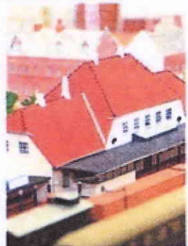
Opførelsen af Vejen Miniby har været i gang længe. Nu tager den historiske gruppe også fat.