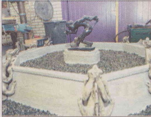
En tro kopi af troldespringvandet er netop opført i målestoksforholdet 1:10.