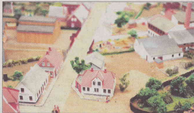
Det såkaldte terrænbord er fremstillet ned i den mindste detalje.