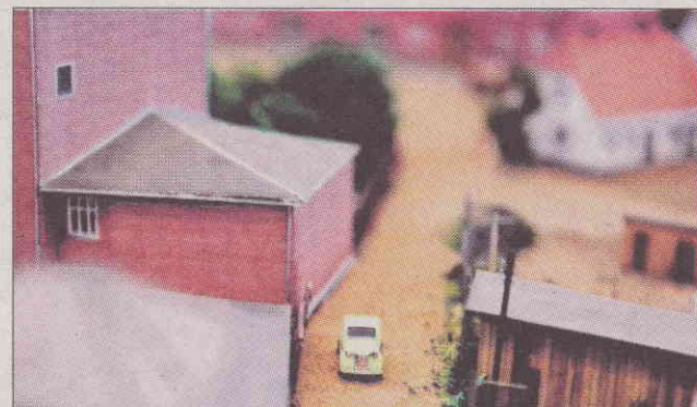
Et kig op ad Tømrergangen med brugsen i baggrunden.