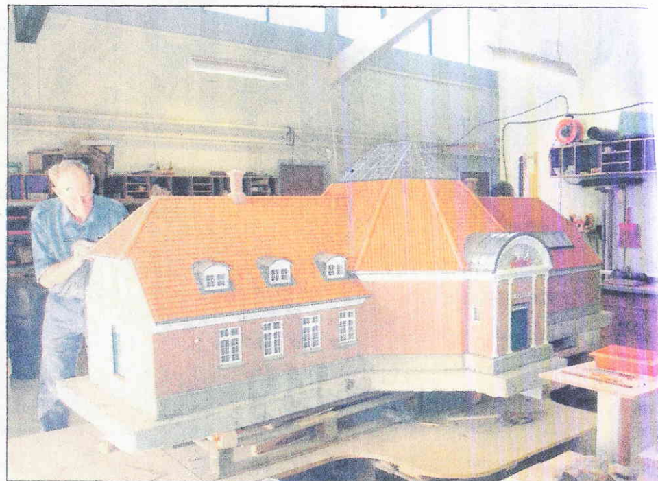
Mini-byggenes arbejde aftvinger respekt og Vejen Miniby er et besøg værd, skriver Tom Tønnies.

»Teglværket« var en oplevelse for sig. Her presser man tegl- og tagsten ud af en slags bollesprøjte med forskellige indsatser, tørrer og