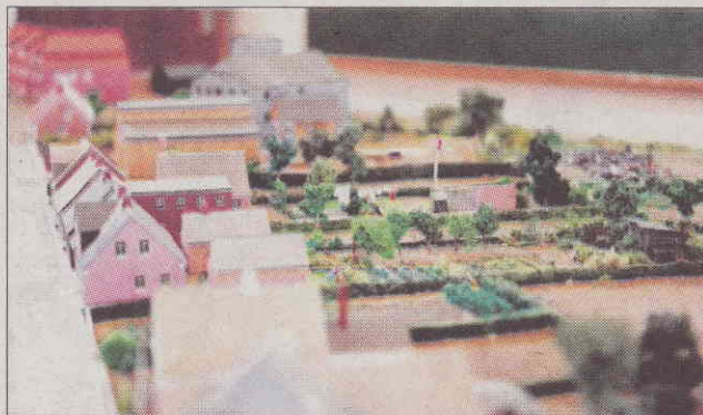
Højre side af Jernbanegade - dengang tilbage i 30'erne.