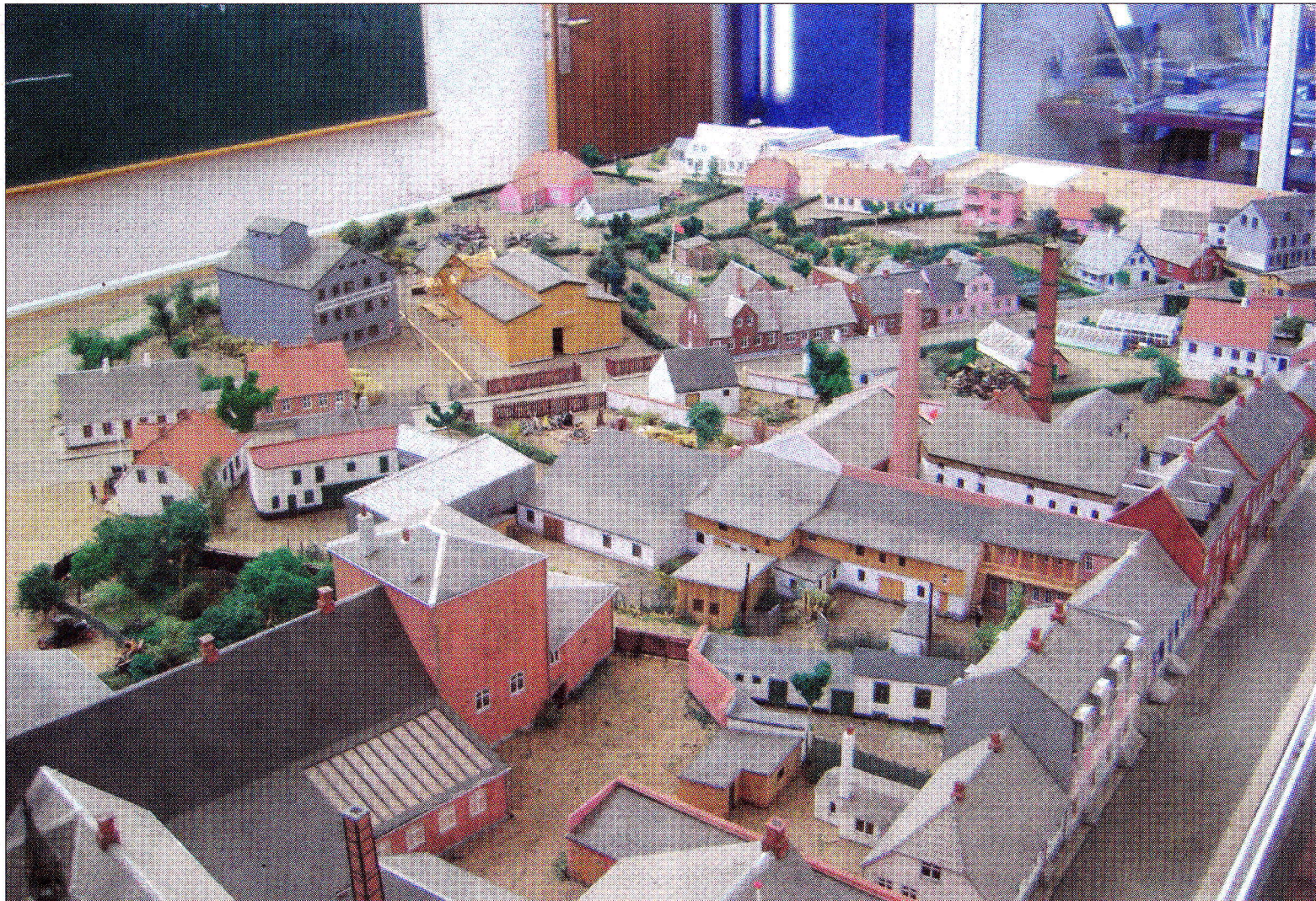
Her ses noget af byen, som den engang så ud.

Jeg drømmer lidt om at blive fotograf, så miniby var et super godt sted at starte.