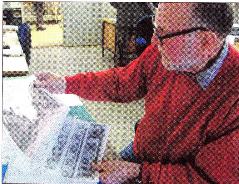
Filip kigger på billeder af et hus.

Vejen Kunstmuseum var den første model, som blev færdig,