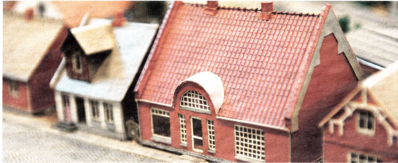
Bblioteket i Vejen har i denne tid en udstilling omkring Vejen Miniby.