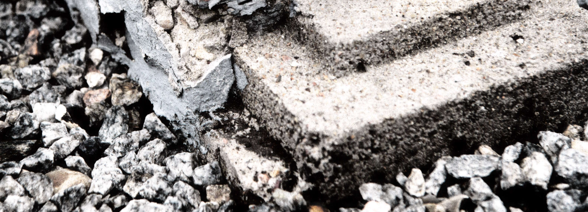
Husene i Vejen Miniby kan ikke holde til at stå ude. Hver gang et hus skal repareres eller bygges op påny, er tusindvis af timer tabt. Derfor håber de frivillige bag minibyen på en snarlig flytning.

En arbejdsplads, hvor "medarbejderne" forlængst har forladt det etablerede arbejdsmarked og frivilligt - og ubetalt - møder ind flere gange om ugen og arbejder koncentreret med at brænde små mursten af ler, fremstille små tagplader af skiffer, studere gamle fotografier og fremstille historiske tegninger af datidens byggeri.